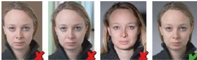
Hintergrund ohne Kontrast

Das Gesicht muss in allen Bereichen scharf abgebildet, kontrastreich und klar sein.